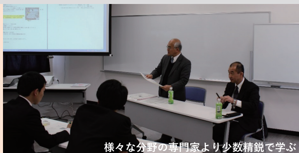
様々な分野の専門家より少数精鋭で学ぶ