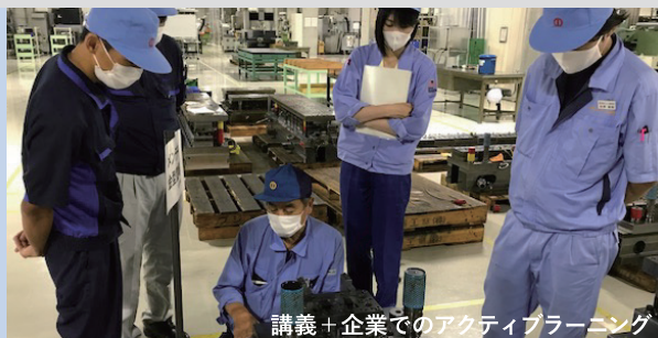
講義+企業でのアクティブラーニング