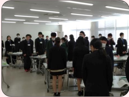
▲ R2.2 ビジネスマナー講座の様子

来春から地元企業に就職する高校3年生に、ビジネスマナーやコミュニケーションを学び、職場で実践できるようにトレーニングをしてもらうとともに、これからの課題と目標を共有することで就職後の仕事や生活への不安を解消し、社会人生活を前向きな気持ちでスタートしてもらうための講座です。