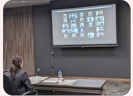
▲ R4.2 リモート方式での講座の様子

受講料 無料 受講定員 40名 申込期限 令和4年12月20日(火)必着 申込方法 就職先事業所を経由してご応募ください 詳しくは南信州・飯田産業センターのウェブサイトをご確認ください 開催会場 南信州広域連合 産業振興と人材育成の拠点 エス・バード